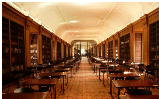
Bibliothèque des Génovéfains, photo ©PIPPA-AAP

Créé en 1804 dans les bâtiments de l'ancienne Abbaye Sainte-Geneviève, le Lycée Henri-IV est sans doute le seul en France à avoir gardé des parties médiévales. Outre une architecture remontant pour partie au 12 e siècle, il conserve également de nombreux décors de l'époque baroque dont le cabinet des médailles, l'oratoire et l'immense bibliothèque des Génovéfains.