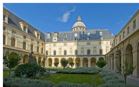
Cloître du Lycée Henri-IV

Le programme, cette année, sera placé sous le thème de « la correspondance », choisi par le Ministère. Signatures, lectures épistolaires, ateliers de dessin et d'écriture... seront proposés au public, dans le cloître du Lycée, pour compléter la découverte des ouvrages. Deux concerts solidaires pour le Japon et le Vietnam, seront organisés au profit de la Croix-Rouge et de l'association SEME, dans la Chapelle du Lycée.